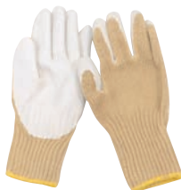
⑤ テクノーラ ゴム引き安全作業手袋 EGG-103N AI