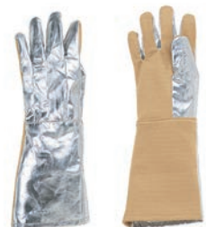
⑧ 5本指グローブ (左右一組) EGF35 AI