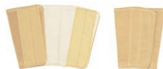
⑪ 手甲 ETK2 AI