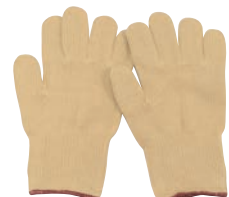
④ 超高密度作業用手袋 EGG-21 AI