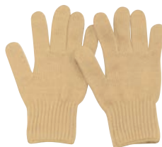
③ 作業用手袋 EGG-1 AI