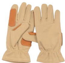
① オートグローブ EGA-1 AI