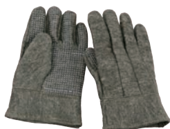
② 5本指手袋 耐熱滑り止め付 EGF-36 AI