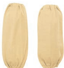
⑨ 腕カバー EAC2 AI