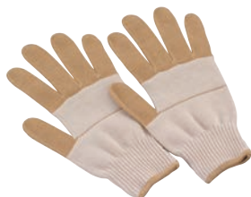
⑦ 作業用手袋 AI