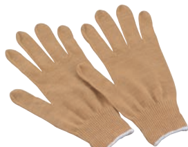
⑥ 作業用手袋 EGG-113L AI