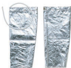
⑩ 腕カバー EAC31 AI